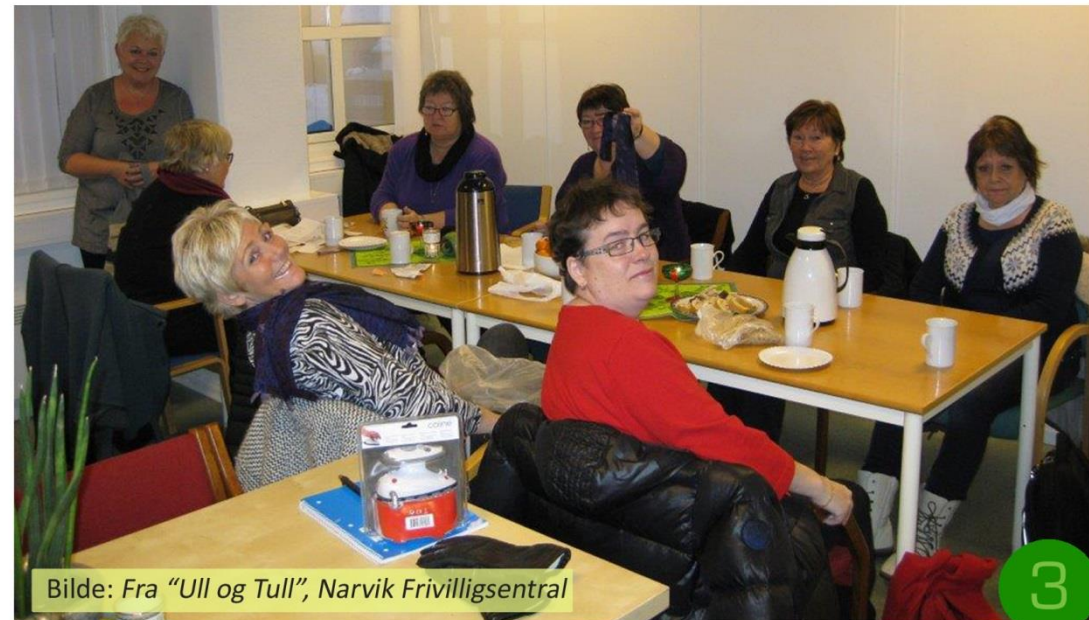
Bilde: Fra "Ull og Tull", Narvik Frivilligsentral